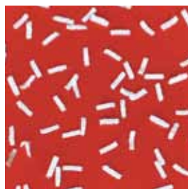
Cross-Cut 0,8 x 4,5 mm DIN Sicherheitsstufe 7 – entspricht Top Secret Anspruch