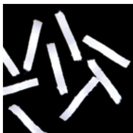
Cross-Cut 1,9 x 15 mm DIN Sicherheitsstufe 5